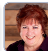
CONSEILLÈRE SIÈGE # 6