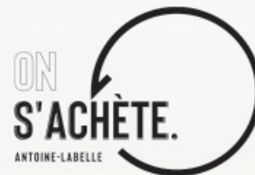
VENTE SOUS LE PARASOL (TROTTOIR) Du 29 juillet au 1 er août