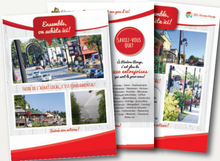
PUBLICATIONS DURANT 13 SEMAINES DANS L'INFORMATION DU NORD Consultez-les au riviere-rouge.ca/vieeconomique