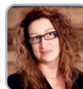
CONSEILLÈRE SIÈGE # 5