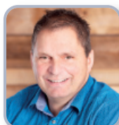
CONSEILLER SIÈGE # 1