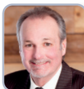
CONSEILLER SIÈGE # 3