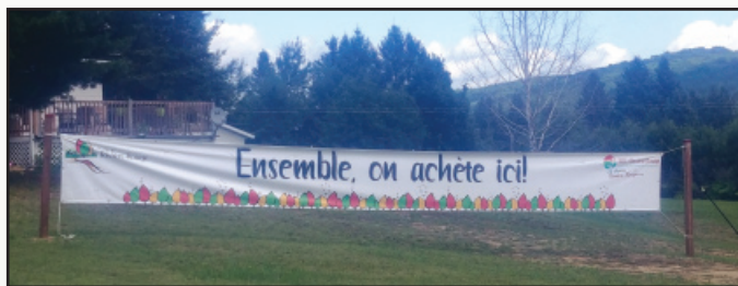
INSTALLATIONS DE BANNIÈRES «VALORISANTES», SECTEUR CENTRE-VILLE (2) ❤️ SECTEUR SAINTE-VÉRONIQUE (1)

VOICI LES ACTIONS RÉALISÉES : ❤️ ❤️ ❤️ ❤️ ❤️ ❤️ ❤️ ❤️ ❤️ ❤️ ❤️ ❤️ ❤️ ❤️ ❤️