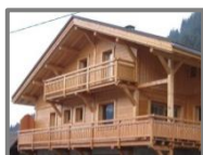
Plate-forme extérieure, en saillie aux murs d'un bâtiment, entourée d'une balustrade ou d'un garde-fou communiquant avec l'intérieur du bâtiment et pouvant être protégée par une toiture.