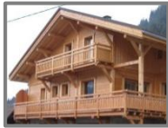
Plate-forme extérieure, en saillie aux murs d'un bâtiment, entourée d'une balustrade ou d'un garde-fou communiquant avec l'intérieur du bâtiment et pouvant être protégée par une toiture.