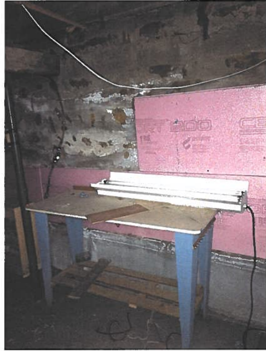
PHOTOGRAPHIES 13 ET 14 : AUTRES VUES SUR LA CAVE