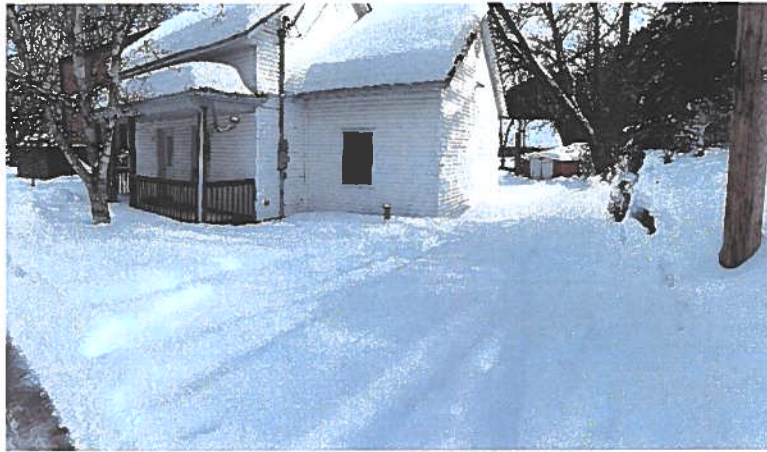
PHOTOGRAPHIE 1: VUE SUR LA MAISON DEPUIS LE NORD-OUEST