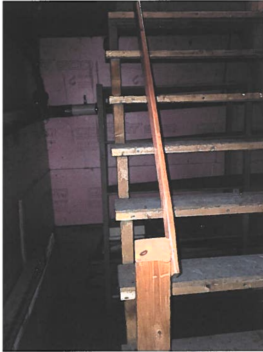
PHOTOGRAPHIES 9 ET 10 : VUE SUR LA TRAPPE ET LA CAVE