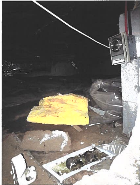
PHOTOGRAPHIES 15 ET 16 : VUE SUR LE TROU DANS LA CAVE