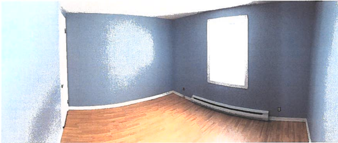
PHOTOGRAPHIE 6 : VUE SUR LA CHAMBRE