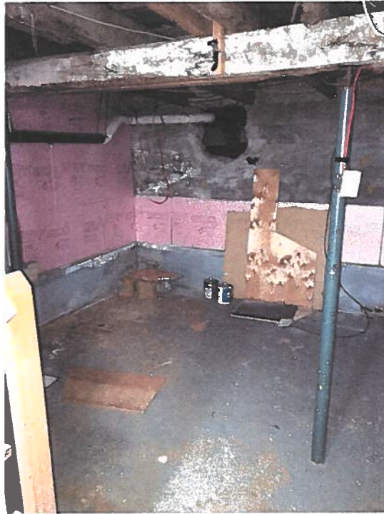
PHOTOGRAPHIES 11 ET 12 : AUTRES VUES SUR LA CAVE