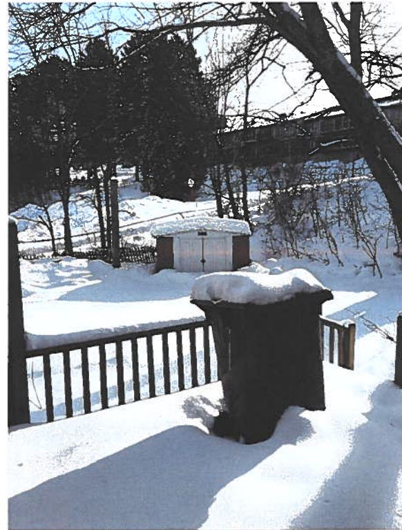
PHOTOGRAPHIES 2 ET 3 : VUE LA COUR DEPUIS LE SUD ET DEPUIS LA MAISON