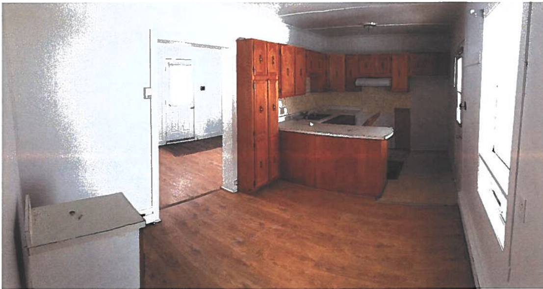
PHOTOGRAPHIE 5 : VUE SUR LA CUISINE