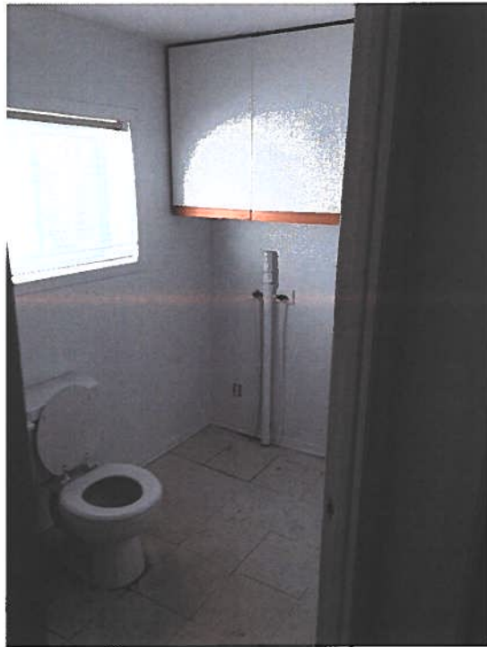
PHOTOGRAPHIES 7 ET 8 : VUE SUR LA SALLE DE BAIN