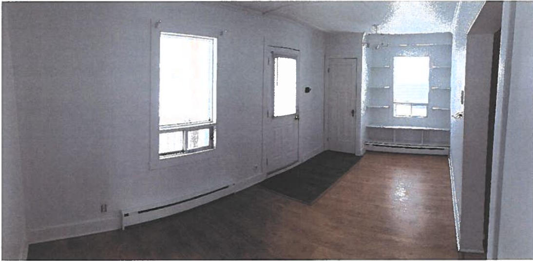
PHOTOGRAPHIE 4 : VUE SUR LE SALON